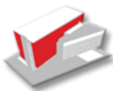
Moravský zemský archiv v Brně

přednáškový sál Státního okresního archivu Pelhřimov