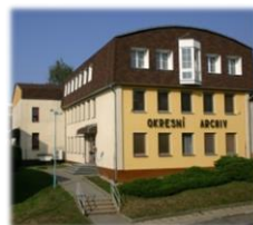
Státní okresní archiv Pelhřimov